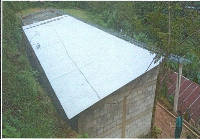
Foto1: Mejoramiento al módulo de aula (estructura de techo con lámina troquelada calibre 26, piso cerámico, balcones, repación de repello y cernido de paredes)