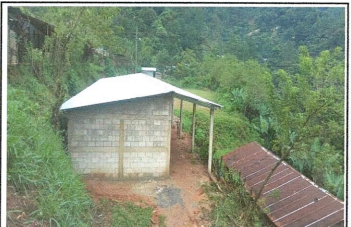
Foto 4: Mejoramiento al módulo de aula (estructura de techo con lámina troquelada calibre 26, piso cerámico, balcones, repación de repello y cernido de paredes)

Observación: Si es necesario se pueden agregar hojas adicionales y actualizar el número de hojas.