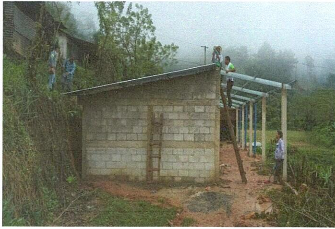
Foto1: Remodelación de aula tipo portico