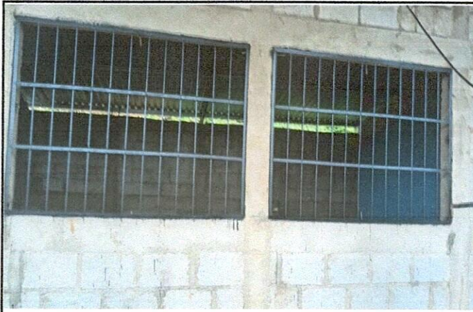
Foto 3: Mejoramiento al módulo de aula (estructura de techo con lámina troquelada calibre 26, piso cerámico, balcones, repación de repello y cernido de paredes)