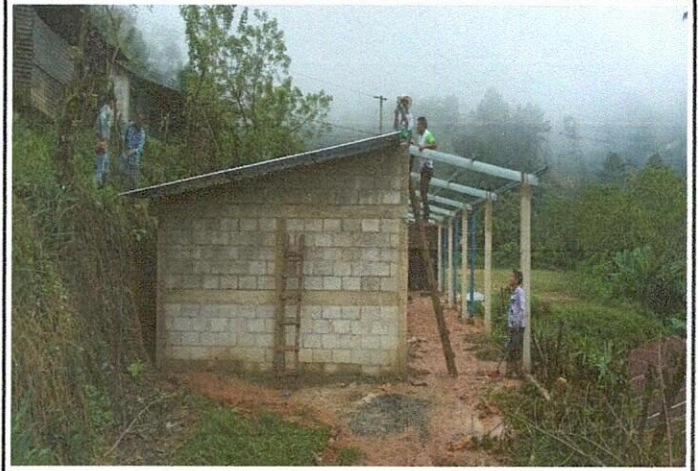
Foto 2: Mejoramiento al módulo de aula (estructura de techo con lámina troquelada calibre 26, piso cerámico, balcones, repación de repello y cernido de paredes)